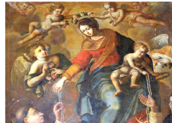
Donation du Rosaire à Bouc-Bel-Air

Ce temps de prière sera un temps d'adoration et d'action de grâce pour les enfants catéchisés, les jeunes de l'aumônerie et tous les animateurs.