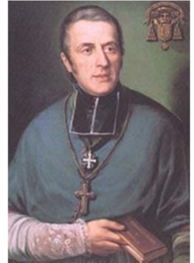
Saint Eugène de Mazenod

« L'Esprit Saint vous fera souvenir de tout ce que je vous ai dit » (Jean 14, 26)