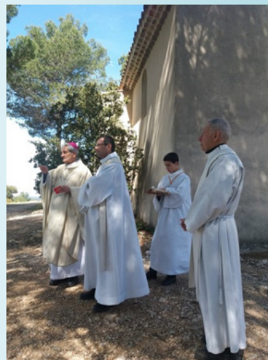
La Chapelle Notre-Dame de l'Espérance à Bouc-Bel-Air