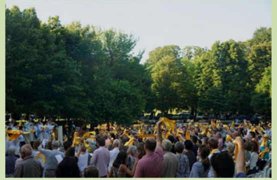
Les Jardins d'Albertas, juin 2018