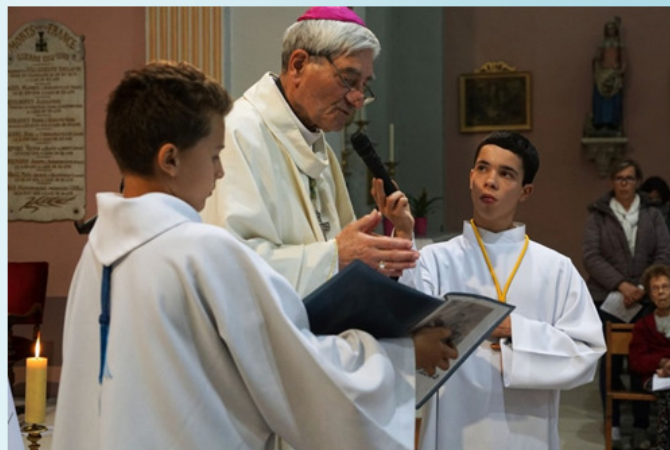
Messe à Calas