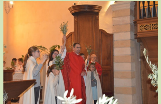
Les Rameaux à Bouc-Bel-Air