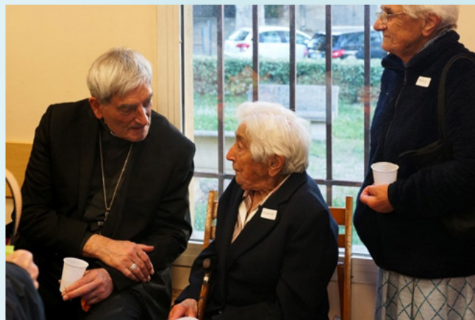
Apéritif à Calas