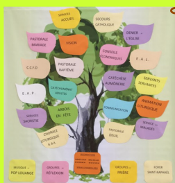
La Trébillane 1 er /10/2017

Réalisons ensemble le rêve du 1 er octobre 2017 !