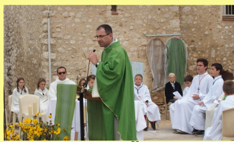
La Trébillane 1 er /10/2017