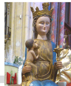
Notre Dame de la Seds

Ouverture de la Neuvaine de prière à Marie jusqu'au 8 décembre. 9h | Messe à Calas