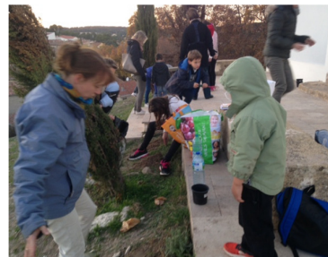
Plantation de lavandes par les enfants à la Chapelle Notre Dame de la Trébillanne

Aumônerie : rencontre des 6 e à la Cathédrale Saint Sauveur