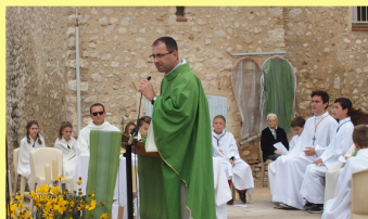
La Trébillane 1 er /10/2017