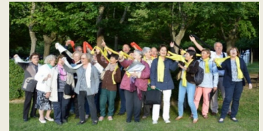
30 e anniversaire de la chorale paroissiale de Bouc Bel Air

10h-11h30 | Catéchèse pour les CM2 à Calas