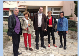
Plus d'images sur le site du Secours catholique

Dans la nuit du 8 au 9 mars, un incendie a ravagé leur entrepôt de Plan de Campagne.